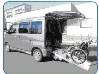
車いす対応車両貸出