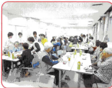
いきいき暮らしの講座