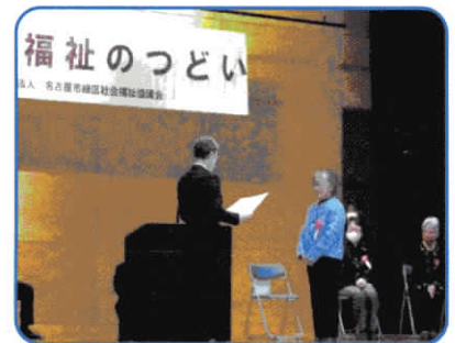
緑区地域福祉のつどい