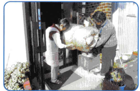
寝具クリーニングサービス事業