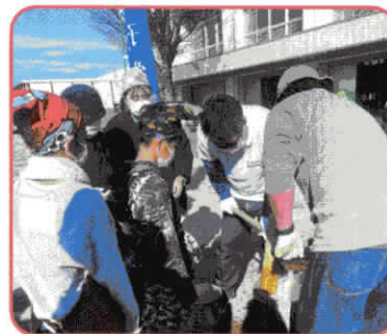
ふれあい餅つきまつり